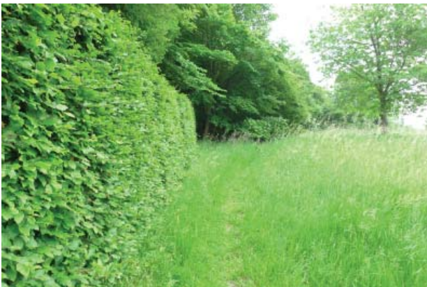
Vejen er ført uden om Gl. Grønholt Vang, og der er slet ingen visuel forbindelse til det gamle forløb gennem skoven - selv om stien inde i skoven findes endnu.

Ved Krydset Jagtvej/Grønholtvangen kunne man også med fordel sikre, at beplantningen ikke hindrer den visuelle oplevelse af de lange lige vejforløb.