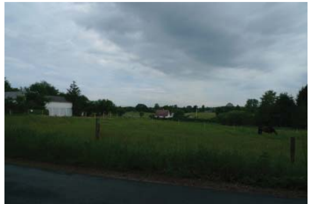
Udsigterne fra parforcevejene afspejler morænefladens let kuperede karakter.

Parforcevejene løber gennem morænebakker med dødisrelief. Det afspejles af det bølgede og varierede landskabsbillede man får fra vejen.