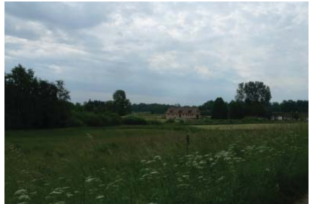
Parforcevejene passerer gennem et småskalalandskab med mange hegn og diger

Bebyggelsen i området er ikke funktionelt eller historisk relateret til parforcevejene, og er derfor ikke beskrevet.