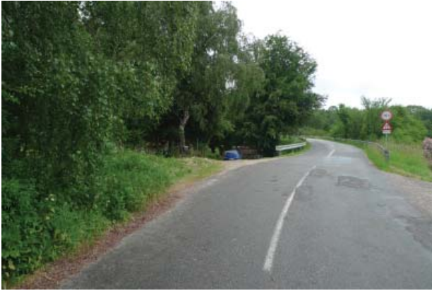
Ved Jernbanebroen er det rette forløb ændret

Særligt langs Jagtvej er der etableret en række husmandssteder. Det giver vejen sit eget præg, der minder om typiske statshusmandsudstyknings.