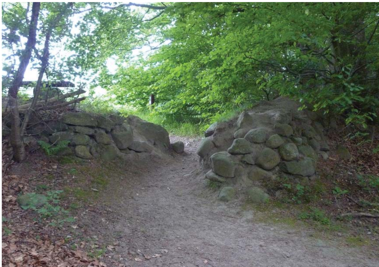
Efter parforcesystemet gik ud af brug er parforcevejen gennem Gl. Grønholt Vang blevet lukket med stendiger, i forbindelse med udskiftningen af skovområderne.

Vejene bevæger sig igennem åbne landskaber vekslende med skovområder. Denne landskabelige sammenhæng kan næppe sammenlignes med det landskab vejene er anlagt i, og som havde mindre skarpe grænser mellem skov og mark. Det eksisterende landskabsbillede fortæller derimod om udskiftningshistorien, ligesom husmandsstederne der i nyere tid er anlagt langs de gamle parforceveje. Disse forhold anses for mindre væsentlige i relation til parforcefortællingen.