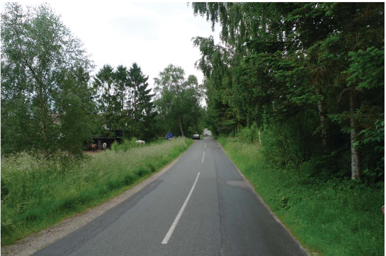
Vejen tegner et snit gennem landskabets former.

Kulturhistorisk Undersøgelse. Pilotprojekt, Nationalpark Kongernes Nordsjælland. Holbo Herreds Kulturhistoriske Centre 2005.