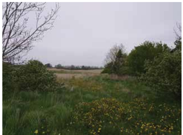
Eng vest for Gunderød og kig mod nord.