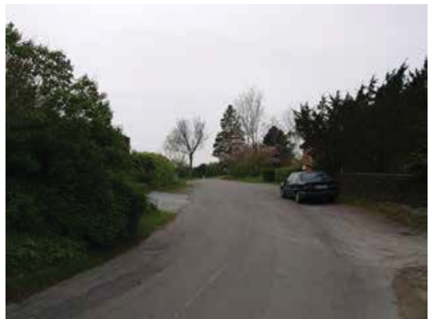
Kig mod vest ad Gunderødvej.