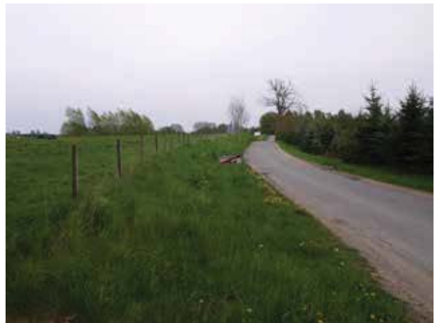
Kig ad Damsholtevej.