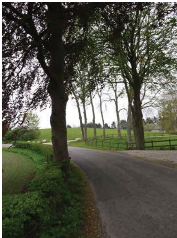
Kig af Gunderødvej mod øst, nord for Damgaard.

Flere steder i Gunderød åbnes der langs vejen op for kig til markerne omkring landsbyen. Disse kig understreger kontrasten mellem det åbne landskab og Gunderøds landsbykarakter. Landsbyens gadekær ligger centralt i byen og formidler historien om vanding af kreaturer eller anvendelse som branddam.