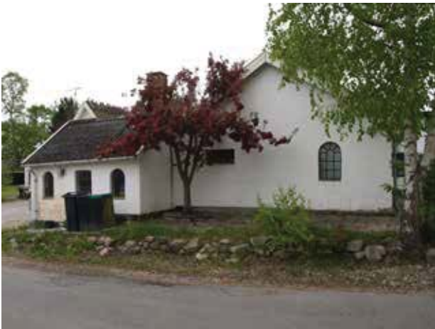
Boligen på hjørnet af Donsevej og Damsholtevej har været landsbyens smedje.