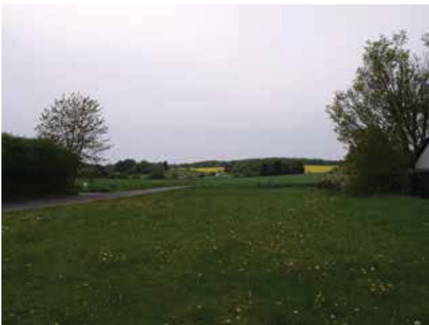
Kig fra Gunderød mod vest og Donsevej.

Landskabet omkring Gunderød er karakteriseret ved de åbne marker, mens der i Gunderød findes tættere beplantning i kraft af landsbyens haver. Den tættere beplantning undersætter landsbyens rumlige forløb og oplevelsen af at være i en landsby.