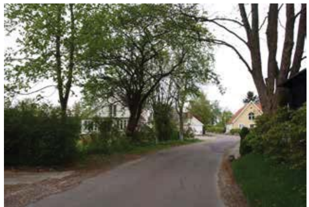
Kig fra syd mod Gunderødgård.