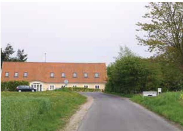
Kig fra Donsevej mod Gunderødgård.

Gadeforløbet i Gunderød er snoet. Både Gunderødvej, Damsholtevej og Donsevej slynger sig igennem landsbyen og forbinder den med det øvrige overordnede vejnet. Disse veje er 'alfarveje' og har indtil åbningen af Kongevejene og etableringen af Isterødvejen været transportårer for landsbyens bønder. De er fint tilpasset landskabets fald og stigninger, hvorfor de slynger sig.