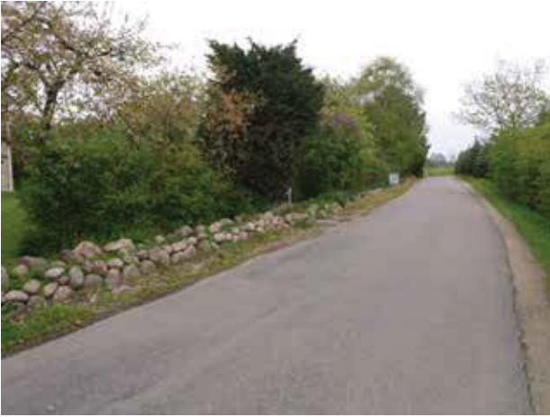
Kig ad Damsholtevej mod øst.