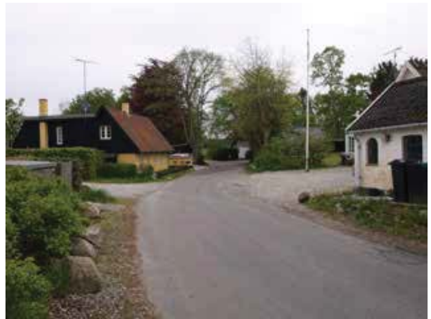
Kig ved Donsevej mod syd ad Damsholtevej.