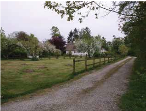
Æblehave ved ankomsten til Gunderød, syd for Donsevej. Ejendommen er en af Gunderøds ældre husmandssteder.