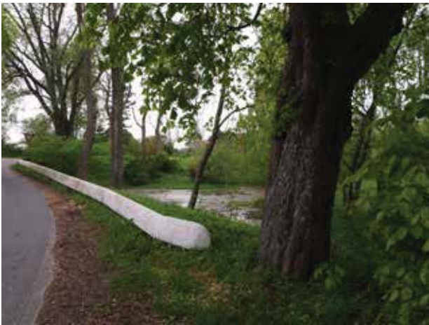
Gadekær i Gunderød.