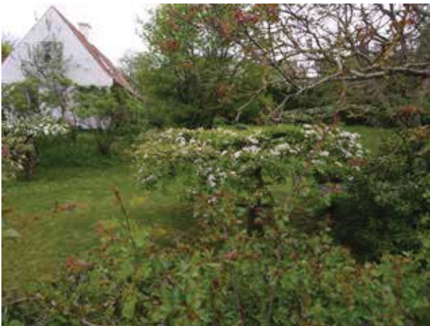
Æblehave vest for Damgaard.