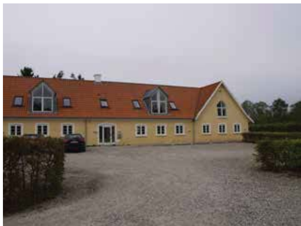
Gunderødgård er en af de oprindelige gårde, som kan spores helt tilbage til udskiftningen af Gunderød.