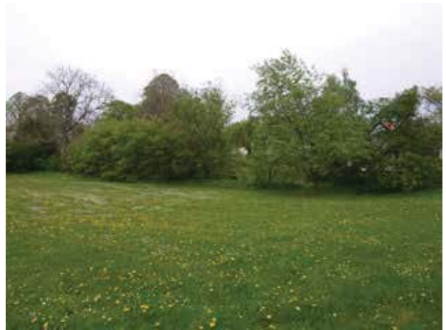
Gammel dige øst for Gunderødgård.