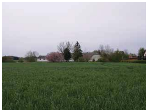
Toftegård set fra Donsevej mod nord hen over markerne. Det er den vestligste gård i Gunderød, som kan spores helt tilbage til udskiftningen. Den firelængede gård er den vestlige afrunding af Gunderød.