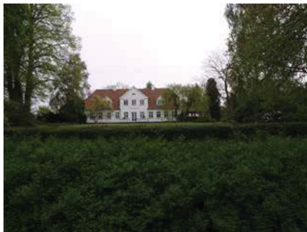
Damgaard set fra nord. Damgaard er en af Gunderøds mere markante gårde med et velproportioneret stuehus og central placering i byen.

Bebyggelsen i Gunderød består hovedsagligt af bygningstypologier. De tre- og firelængede gårde, som fremgår med rødt af kortet side 4, er de dominerende bygninger i Gunderød. Indimellem ligger huse, som også kan aflæses af kortet fra 1807 (side 6). Husene har forsynet de større gårde med den nødvendige arbejdskraft til landbrugsdriften i området.