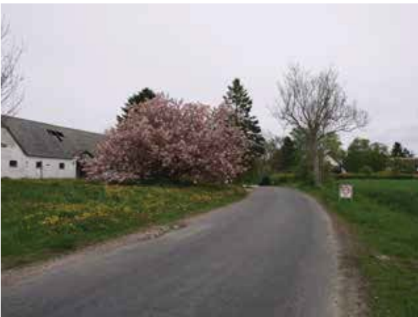
Kig mod øst af Gunderødvej mod Gunderød.