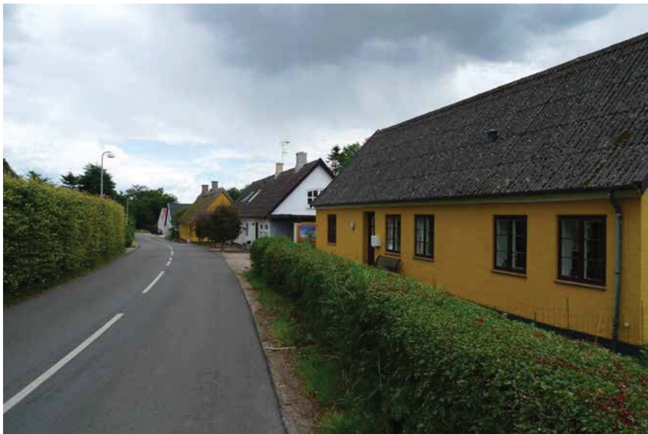
Rækken af mindre håndværker- og landarbejderhuse er et centralt karaktertræk i Langstrup.

På de bevarede gårde er det en udfordring at anvende gårdenes driftsbygninger i takt med at gårdene ikke længere indgår i landbrugsmæssig drift. Der kan derfor opstå ønske om nedrivning, hvilket vil ændre landsbyens fortællerværdi markant.