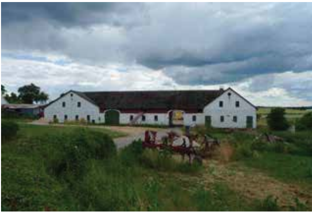
Driftsbygningerne er et markant element i landsbymiljøet.

De åbne kig til Langstrup Mose er sårbare over for beplantning med skov.