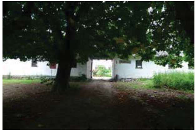
Draghøjgaard er en af de fire gårde, som endnu ligger i landsbyen. Den gamle katasnieallé ind til gården understreger oplevelsen af oprindelighed.

I de følgende år opstod en stram, reguleret bebyggelse med huse i stedet for de udflyttede gårde og i løbet af 1800 tallet blev den nordligste af de tilbageværende gårde nedlagt, hvorved bebyggelsen i det store og hele fik den form, der ses i dag. Enkelte nye huse er kommet til og ved den østlige gård er nye bygninger opført lige nord for den oprindelige gård.