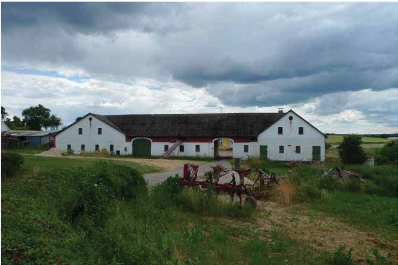
Brønsbjerggård ligger frit i landskabet med sin markante facade med to porte og karakteristiske gavle.

Kilder: Johs. T. Christensen: Fra Udskiftningstiden i Nordsjælland : Langstrups og Dauglykkes Udskiftning (I: Fra Frederiksborg Amt, årg. 7 (1912), S. 105-29, ill.)