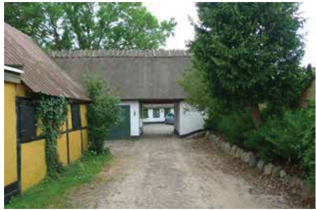
Selvom mange af husene er ret ombyggede, er der også bevaret mange fine, fortællende detaljer.

Bygningsarkitektonisk er det især de to bevarede firlængede gårde, der påkalder sig interesse.