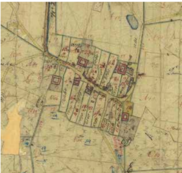
Udsnit af udskiftningskort fra 1788 (øverst) og Original 1 kort gældende fra 1816. Sammenligner man de to kort ses det tydeligt, hvor dramatisk udskiftning og udflytning inden for ganske få år ændrede byens bebyggelse.

Den meget effektive udskiftning betød, at hele 17 af de 22 gårde måtte udflyttes - der blev trukket lod om, hvilke gårde der måtte blive i landsbyen. Tilbage i byen blev udover de fem gårde kun enkelte huse langs landsbygaden. Den effektive udskiftning og store udflytningsgrad skal måske ses i lyset af, at landsbyen hørte under Kronborg Amt.