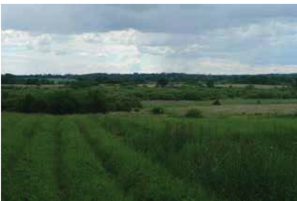
Åbent kig mod Langstrup Mose i den østlige ende af landsbyen.

De åbne kig til Langstrup Mose er sårbare over for beplantning med skov.