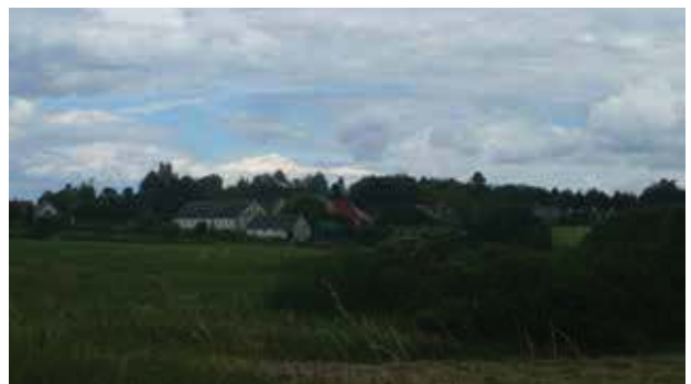
Træplantningen nord for byen understreger bakken og byens beliggenhed på overgangen mellem mose og morænebakke.

Den præcise placering mellem mose og morænebakke opleves tydeligt, når man færdes i byen. Landsbygaden følger terrænet og mellem bygningerne er der flere steder lange kig mod de flade enge i mosen, mens bakken bag byen fremstår træklædt.