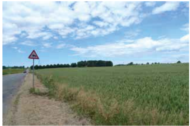
Kig ud over det letbølgede morænelandskab nordvest for Langstrup.

Placeringen på kanten af mosen gav landsbyen let adgang til både eng og tørv i mosen samt dyrkede marker og overdrev på morænefladen nord for byen.