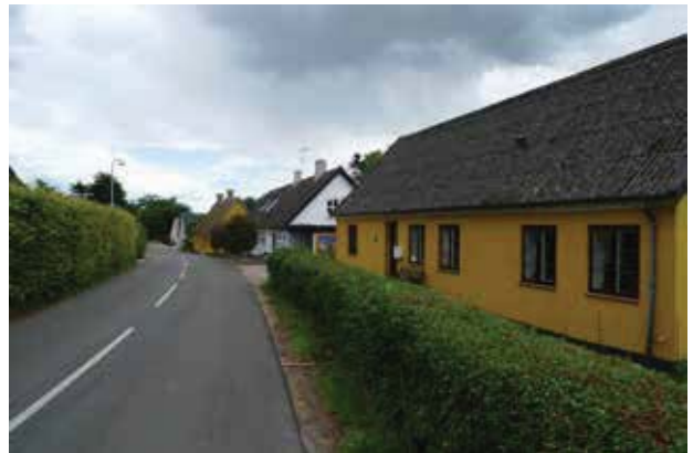
Den stramt regulerede struktur af huse langs landsbygaden er især tydelig på sydsiden.