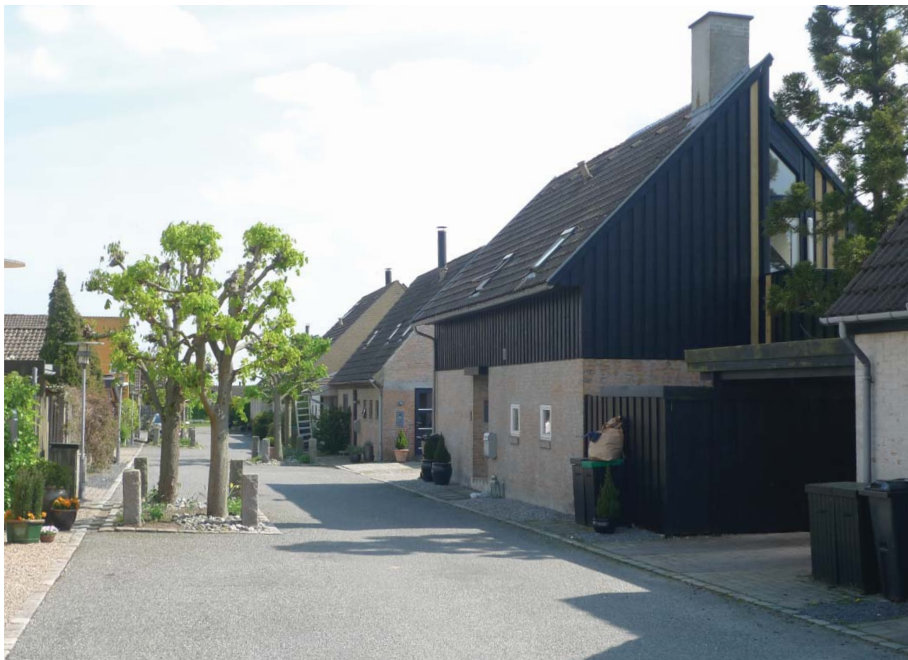
Gadebillede med mindelser om sydeuropæiske landsbyer

Området er, netop på grund af sin oprindelse med individuelt formede bygninger, ret robust overfor ændringer i de enkelte bygninger. Dog bør der være opmærksomhed på, at de grundlæggende karaktertræk og materialeholdningen bevares. Karakteren vil kunne ændres noget, hvis bygninger nedrives og erstattes af ny bebyggelse som ikke indpasses i bebyggelsesstrukturen. Den tætte struktur med små matrikler sikrer dog i nogen grad mod dette.