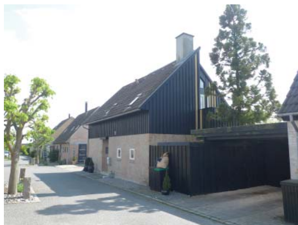
Bebyggelsen er varieret, men har samtidig en række fællestræk i blandt andet materialebrug og detaljering, som giver et sammenhængende præg

Bebyggelsen rummer 21 huse på et areal, der ved normal parcelhus udstykning ville rumme omkring 8 huse. Tætheden sammen med variationen giver bebyggelsen en intimitet og egen karakter, der tit savnes i traditionelle parcelhusområder.