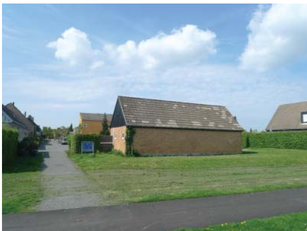
Arealet omkring fælleshuset er åbent ud mod stisystemet

Studiebyen ligger i et område med parcelhusbebyggelse, og en tidstypisk planløsning med trafikseparerede stisystemer, fordelingsveje og adgangsveje i et altovervejende ortogonalt system. Studiebyen ligger for enden af en adgangsvej, og adskiller sig fra den omkringliggende parcelhusbebyggelse ved den fælles parkeringsplads, der kantet af træerækker repræsenterer et brud med parcelhusvejens hække.