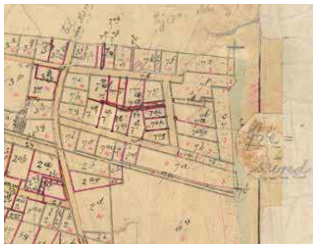
Udsnit af matrikelkort fra 1904-1933, der viser stiforbindelsen til den fælles strandlod.

Områdets oprindelse som sommerhusområde med udgangspunkt i kysten kan udover arkitekturen tydeligt aflæses i eksistensen af en række private eller fælles stier, som mellem kystvillaerne leder ned til små strandlodder. På den måde har også ejere af huse på landsiden kunnet skaffe sig adgang til vandet. Særlig karakteristisk er den fælles sti, som leder fra husene mellem Linde Allé og Kastanie Allé ned til en større fælles strandlod.