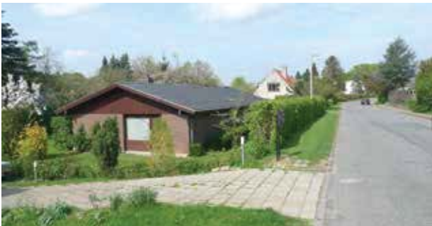
Bebyggelsen på landsiden er langt mere ydmyg og ligger ofte lavere end på vandsiden.