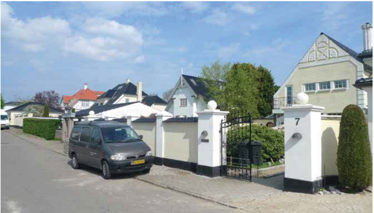
Vandsiden domineres af en perlerække af store villaer, hovedparten veltegnede og velbevarede eksempler på tidens villaarkitektur.