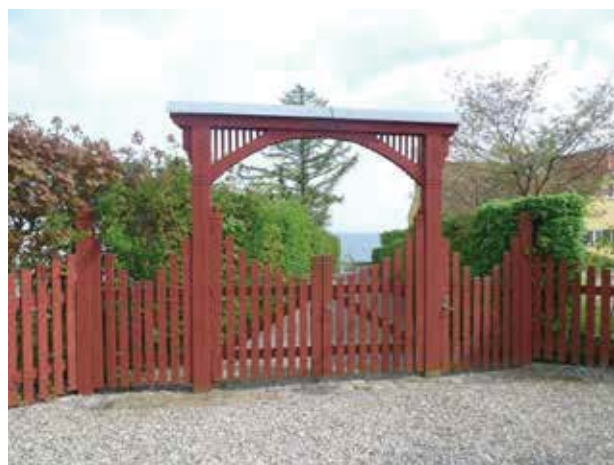
Lågen ind til den fælles strandlod.