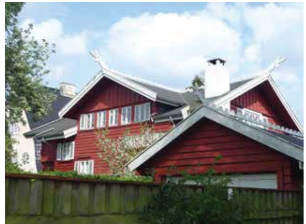
Området er et katalog over villastilarter i starten af 1900-tallet. Her nordisk nationalromantik for fuld udblæsning.