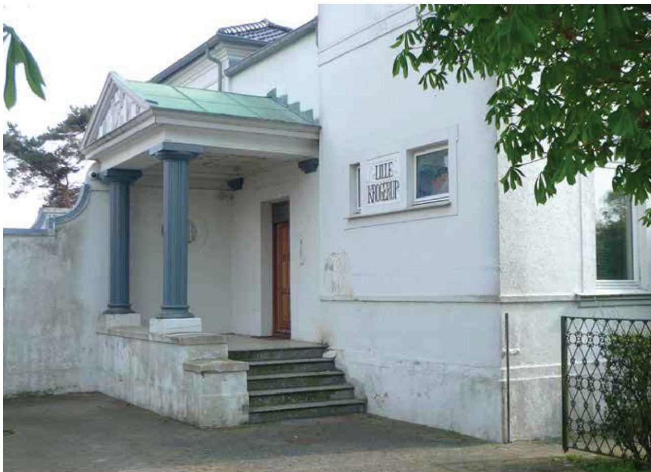
Lille Krogerup er blandt de mest imponerende villaer i området.

Området er særdeles attraktivt, og det medfører et stort pres på bebyggelsen i form af ønsker om tilbygning og ombygninger, som ikke altid er harmoniske i forhold til de oprindelige bygninger. På trods af bygningernes generelle høje bevaringsværdi kan der også være ønske om nedrivning og opførelse