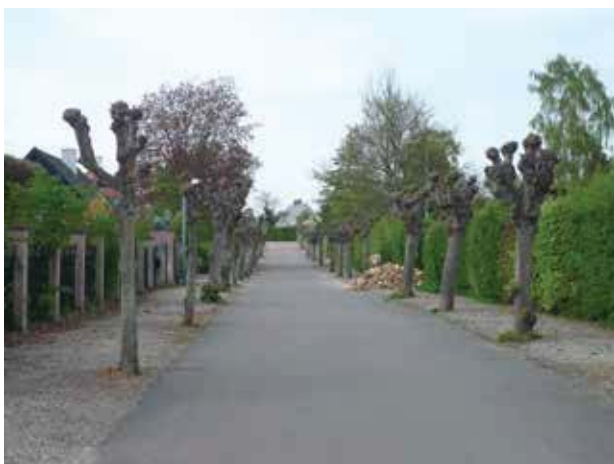
Alléerne på Linde Allé og Kastanie Allé er et originalt træk fra den tidligste udstykning i området.

Linde Allé og Kastanie Allé er de tidligst anlagte villaveje og kan ses på målebordsbladet fra omkring 1900 umiddelbart efter åbningen af kystbanen. Men hurtigt blev området mere attraktivt, og umiddelbart efter århundredeskiftet anlagdes Kystvej øst for den gamle Strandvej.