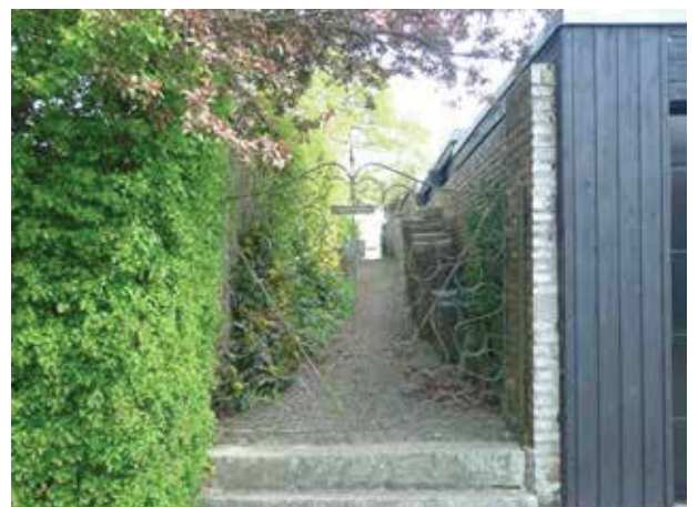
Små lodder giver adgang til stranden. Det personlige præg på strandlodden er et fint indslag i områdets arkitektur.