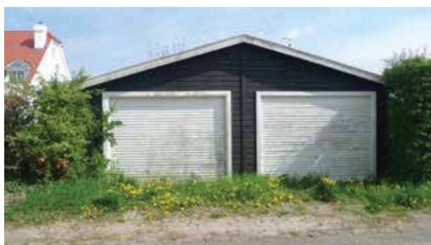
Mange steder er garagerne den mest synlige del af bebyggelsen.