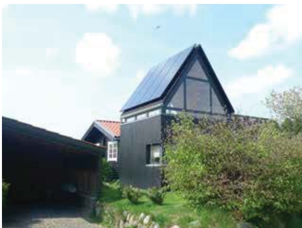
Rester af et mere ydmygt sommerhusbyggeri anes stadig på landsiden af Gl. Strandvej. Her er nyere tilbygninger søgt tilpasset ved at genbruge den oprindelige materiale- og farveholdning.

I første omgang blev kun kystsiden bebygget med store pragtvillaer, mens vestsiden af vejene blev