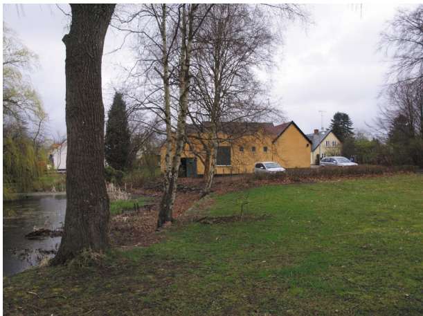
Den ene, bevarede gadekær ved den tidligere landsbyforde er et vigtigt træk i den velbevarede struktur.

Landsbyens tyngdepunkt var dog fortsat i den sydlige del hvor kirken, kroen og to gadekær var samlet om en landsbyforde, som i store træk genfindes i dag som det grønne område ved Ved Dammen.