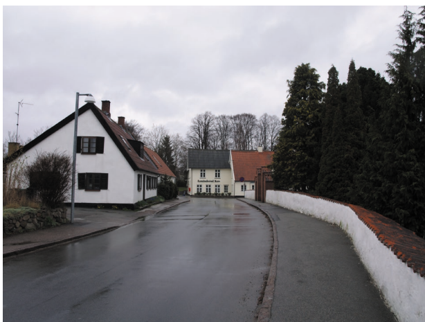
Kirkegårdsmur og kro giver bybilledet karakter og historisk forankring

Landsbyens oprindelige vejstruktur var opbygget af en enkelt slynget landsbygade, der fortsatte mod nord mod Endrup og Veksebo. I den sydlige del forgrenede vejen sig med en gren mod øst til Langstrup, og en mod sydvest til Grønholt. Ved anlæggelsen af Fredensborg blev der desuden ført en vej mod nord til slotsbyen. Den gamle forbindelse mod Endrup blev derved svækket. Med anlæggelsen af Benediktevej midt i 1900-tallet bliver den helt afskåret fra resten af landsbygaden.