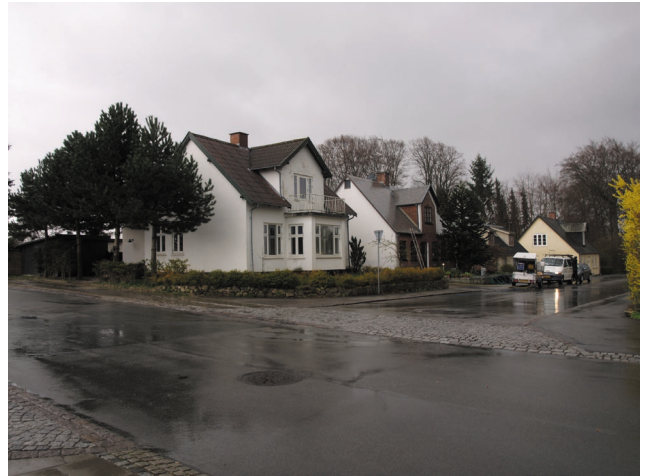
Rigt detaljeret romantisk hus på Ved Dammen (tv), og de mere ydmyge småhuse på Asminderødgade (th).