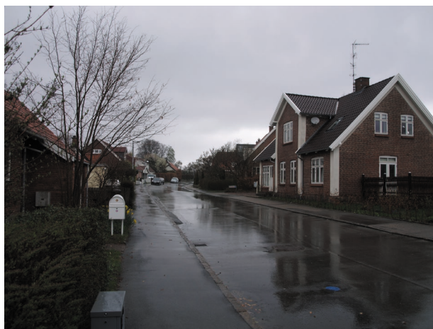
Toftegårdsvænget (øverst) bryder med det ellers fine, homogene miljø i Asminderødgade (nederst)

Bebyggelsen fremstår ret blandet. De ældste bevarede bygninger findes på Ved Dammen og Vinkelvej, hvor man finder typisk byggeskik med lave, stråttækte og hvidkalkede huse. Bebyggelsen langs Asminderødgade omfatter en lang række fritliggende huse, der spænder fra mere simple huse til egentlige villaer. Langs Præstevej ligger hovedsageligt lidt nyere huse fra starten af 1900-tallet, og her findes flere fine Bedre Byggeskik huse. Af landsbyens oprindelige gårde er kun enkelte delvist bevaret, først og fremmest præstegården.