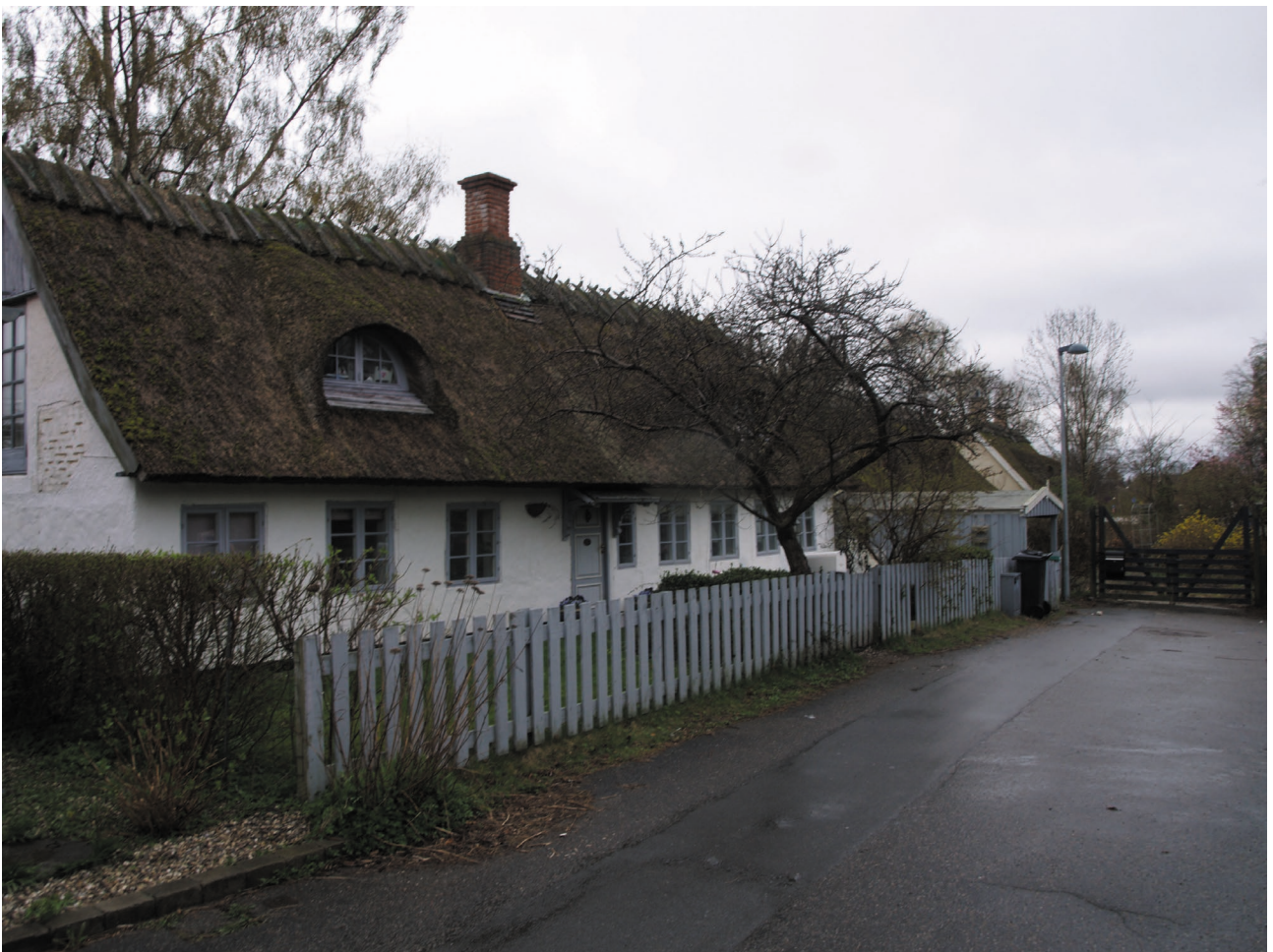
Nogle af byens ældste, velbevarede huse ligger på Vinkelvej.