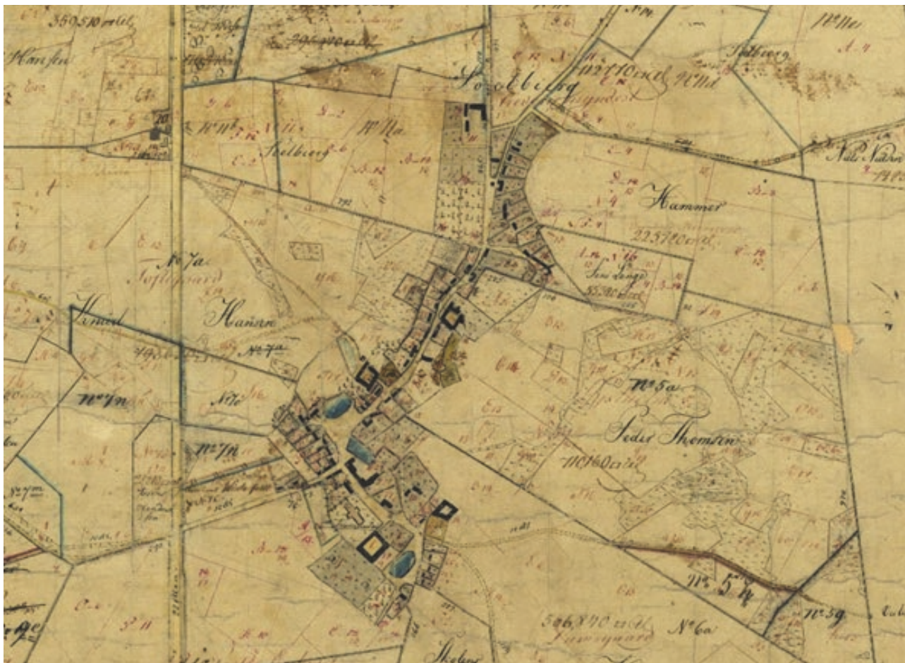
Asminderød 1813. Original 1 kort.

I slutningen af 1600-tallet opføres en kro i byen. Men den store udvikling kom med opførelsen af Fredensborg Slot i 1719-23. Kongen ville ikke tillade soldater og håndværkere at bosætte sig ved selve slottet, og de måtte i stedet indkvarteres i det nærliggende Asminderød. I 1749 nedbrændt store dele af landsbyen, herunder kroen, og ved genopførelsen fik landsbyen sit nuværende, mere bymæssige præg med en række småhuse, som blev opført langs vejen mod Fredensborg. Småhusene var i mange tilfælde boliger for pensionerede tjenestefolk fra slottet, og håndværkere som forsynede hoffet. Asminderød er således fra dette tidspunkt ikke længere kun en landsby, baseret på landbrug, men