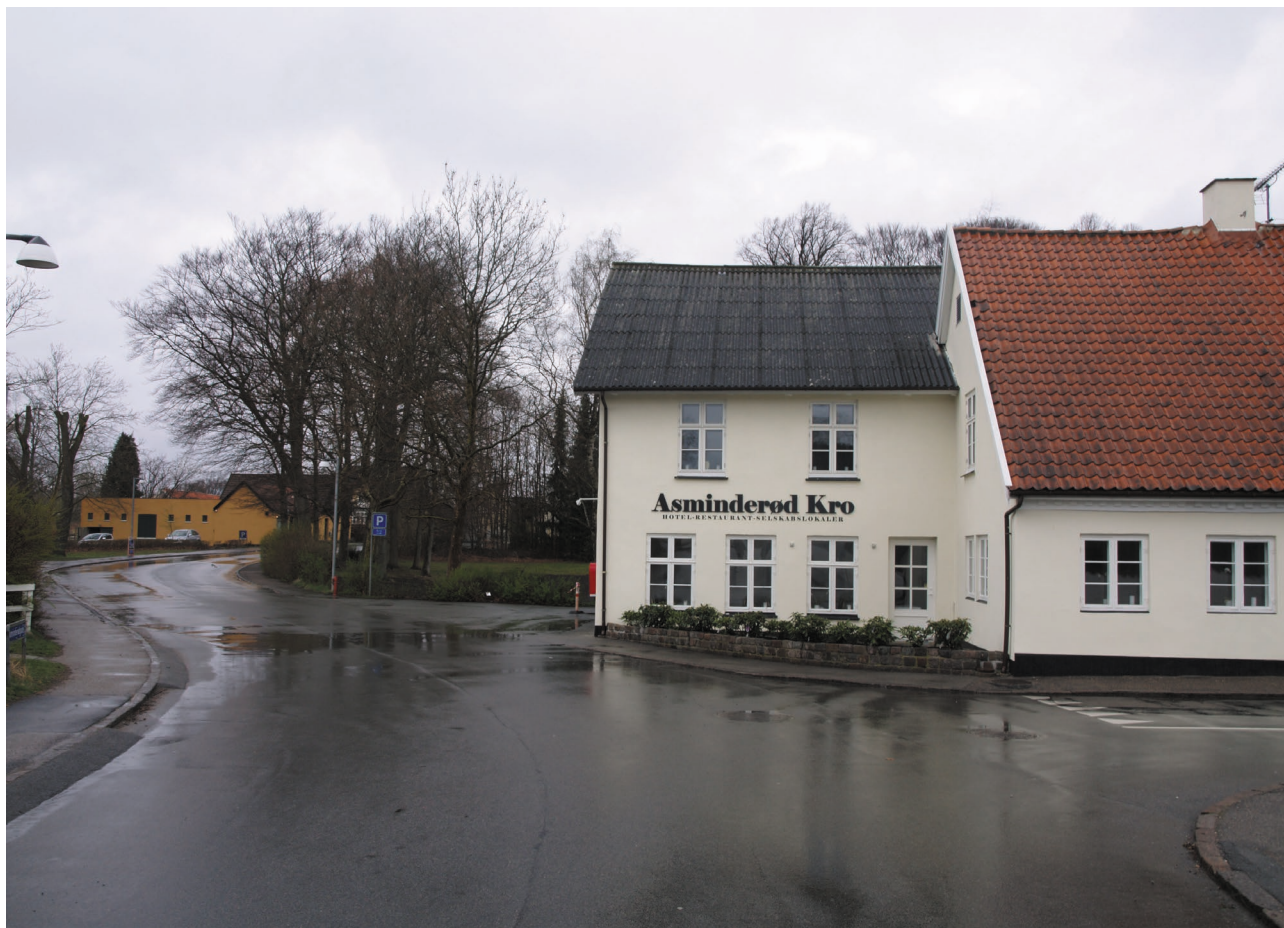
Asminderød Kro markerer landsbymidten med sin højde og beliggenhed lige hvor gaden knækker.

Områdets overordnede vejstruktur er ikke umiddelbart sårbar. Den visuelle sammenhæng fra Asminderødgade til Vinkelvej kunne eventuelt styrkes. Bebyggelsen er generelt sårbar overfor istandsættelse, herunder særligt udskiftning af vinduer, dårligt tilpassede tagformer og oppudsning af murede facader. Karakteren især langs Asminderødgade hænger tæt sammen med bebyggelsesformen, og miljøet kan derfor ikke bære mange udskiftninger af ældre bebyggelse med ny, medmindre den nye bebyggelse nøje tilpasses i skala, form og placering.