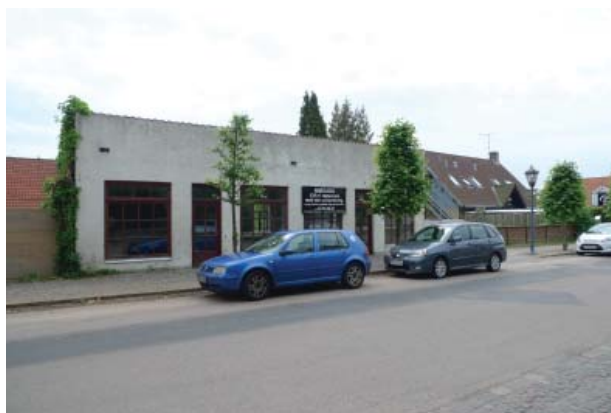
Bebyggelsen i Slotsgade er forskelligartet, men mange af husene er længehuse med frontkvist, og de fleste fint detaljerede. Kun enkelte huse - som nederst - skiller sig helt ud fra typologien og forstyrrer det ellers harmoniske gadebillede