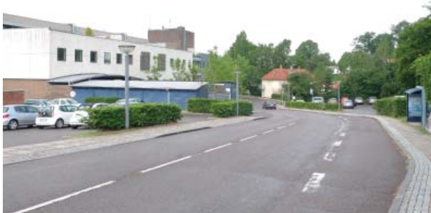
Gadegennembrud og arkitektur der ikke er indpasset i skala og karakter skæmmer nogen steder bybilledet

Beskriver det grundlag, som kulturmiljøet er opstået i (for landsbyer o.lign. vil det være naturgrundlaget, mens det for eksempelvis forstadsområder o.lign. vil være den forudgående bebyggelsesmæssige kontekst).