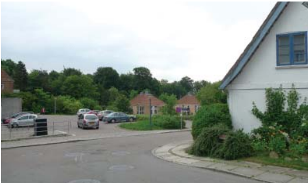
Jernbanegade fremstår urban med sammenbygget bebyggelse i 1½-5 etager. Bebyggelsen er trods enkelte nyere huse der bryder skalaen overvejende homogen. På bagsiden af gaden er der både mod nord og syd lavet gadegennembrud, hvor bystrukturen bliver diffus og sammenhængene mindre klare.