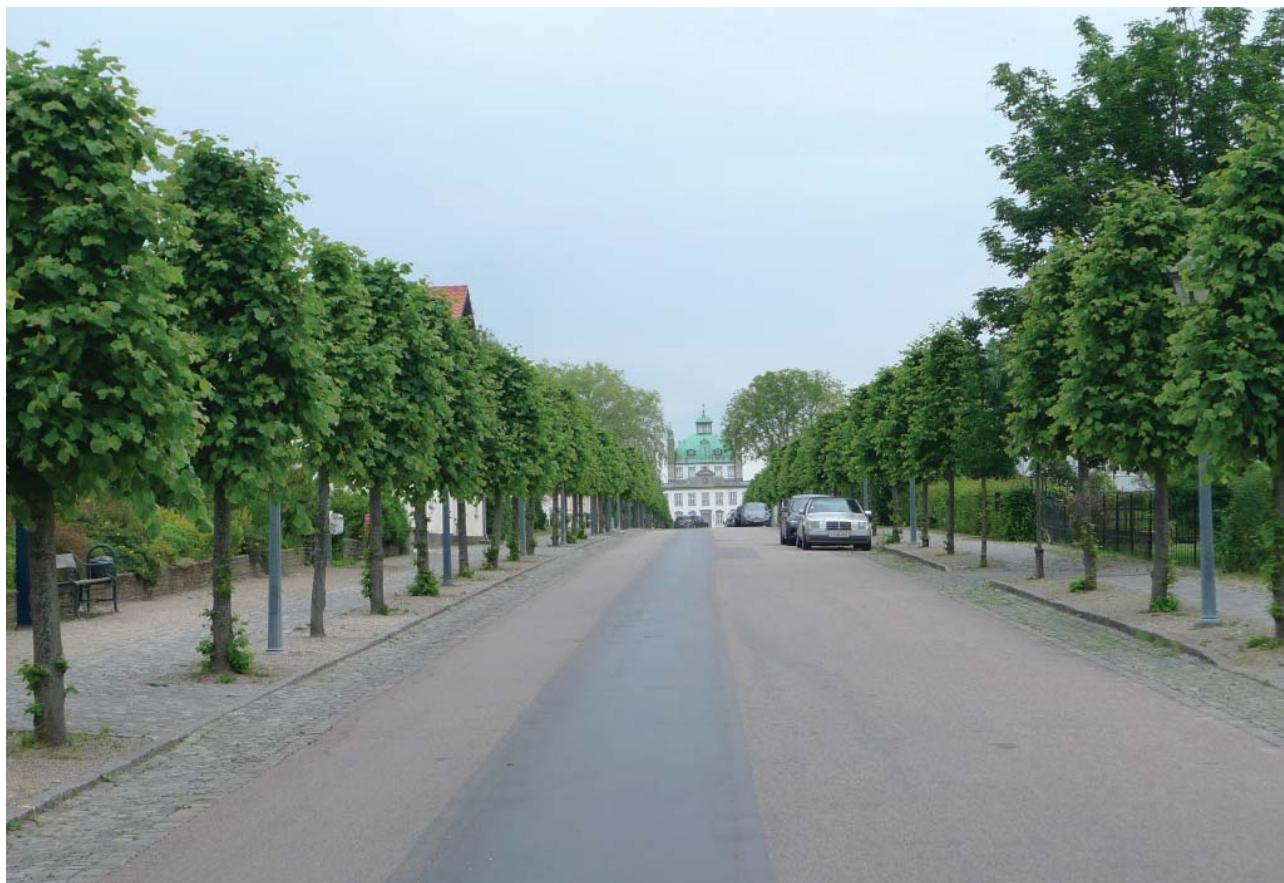
Slotsgade er Fredensborgs raison d'être og omdrejningspunkt. Slottets arkitektur udnytter dygtigt terrænet, så man på afstand bare ser selve slotsbygningen.

Hertil rummer området en række væsentlige bygninger, især i Slotsgade, men også Kejserens Villa, den tidligere biograf ved Langedam, Tinghuset og Vandtårnet er væsentlige for byens karakter og fortælling.