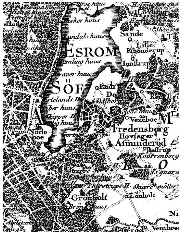
Udsnit af Videnskabernes Selskabs kort. Fredensborg slot og by ses omgivet af skov, men sydøst for byen er terrænet domineret af landbrugsland.

Hovedparten af området lå således som skov inden opførelsen af byen, og på Videnskabernes Selskabs Kort er byen fortsat omgivet af skov til alle sider.