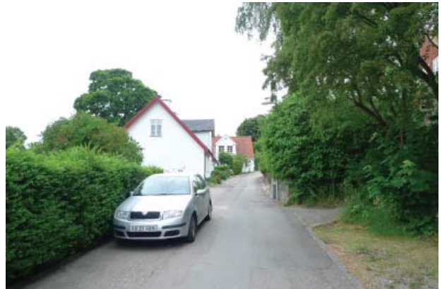
Både Kronprinsensgade og Bagergade har en mere selvgroet, landsbyagtig karakter end de mere bymæssige hovedstrøg Slotsgade og Jernbanegade