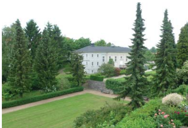
Den gamle biograf i det grønne stræk ved Langedam er et eksempel på hvordan slotsbyen ændrer karakter og optager stationsbyens funktioner - men indpasset i den karakteristiske bystruktur.

I 1964 blev en ny "moderne" byplan vedtaget, som medførte en del nedrivninger og opførelsen af Fredensborg Midtpunkt, samt etableringen af parkeringspladser og adgangsveje nord og syd for Jernbanegade.