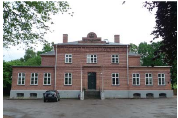
Tinghuset ligger som point de vue for enden af Tingvej.