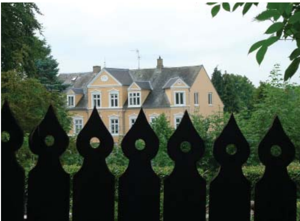
Fine villaer på Kejsereens vej lige ved Slotsparken. Øverst Kejsereens villa.