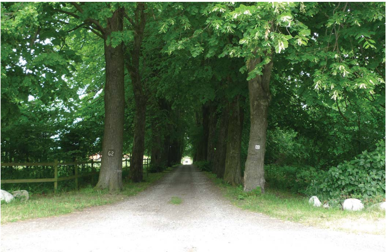
Karakterfuld allé markerer indkørslen til en af udflyttergårdene