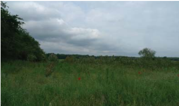
Der foregår fortsat skovrejsning i området, og det kan bidrage til at sløre den ellers rene udskiftningsstruktur

Oplevelsen af ejerlavets udskiftningsstruktur trues af en ret omfattende tilplantning med skov, som slører muligheden for at afkode rækken af udflyttergårde særligt i den nordlige del af ejerlavet. Den megen skovplantning slører også forskellen mellem landbrugslandet og de store samlede skovarealer i Store Dyrehave og Grønholt Hegn.