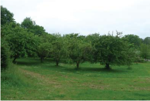
Nogle steder ses bevarede abildgårde, som bidrager til oplevelsen af landsbymiljø og byens landskabelige karakter.

Arkitektonisk er det især udflyttergårdene i den nordøstlige del af ejerlavet der påkalder sig interesse. Gårdene er opført som typebebyggelser, med næsten ensartet udformning af bygningskrop og detaljer, og flere af dem er velbevarede - enkelte er dog helt erstattet af nyere bygninger.