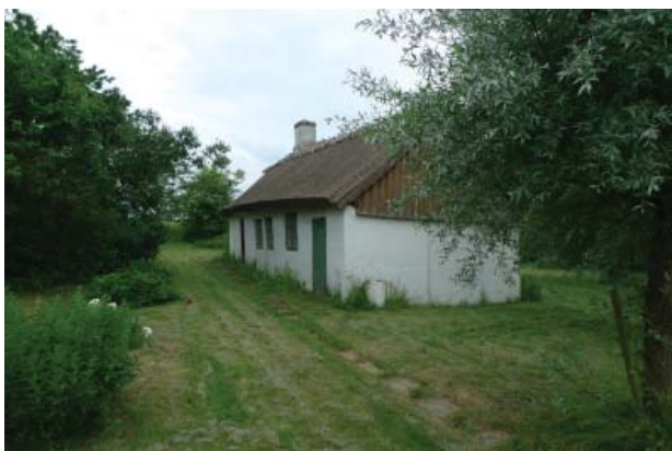
Den gamle smedje er et velbevaret og karakteristisk indslag i landsbymiljøet

I dag er fire gårde bevaret i selve landsbyen, som herudover præges af en række huse og håndværkerboliger. En af præstegårdens oprindelige længer er bevaret og fint restaureret. Karakteristiske er desuden den gamle smedje midt i byen, og naturligvis vejrmøllen lige syd for byen.