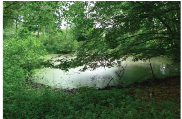
Mange små afløbsløse vandhuller præger området.

Områdets dødisrelief opleves ganske tydeligt som et stort antal hovedsageligt mindre, afløbsløse søer og damme, som findes spredt i hele ejerlavet.