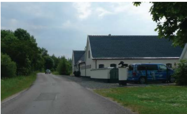
Ufølsom renovering kan svække det oplevelsen af ejerlavets ensartede udflyttergårde