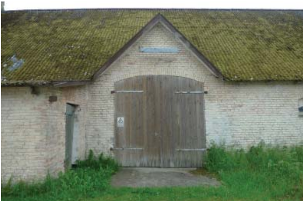
Nedslidte bygninger kan have stor betydning for miljøets identitet og fortællerværdi, og det er værd at søge at bevare dem.

Nogle af de bevarede gårde og ældre landsbyhuse er i mindre god stand, og der kan være risiko for at de nedrives og erstattes af nybyggeri, eller istandsættes på en måde så de ikke længere fremstår originale.