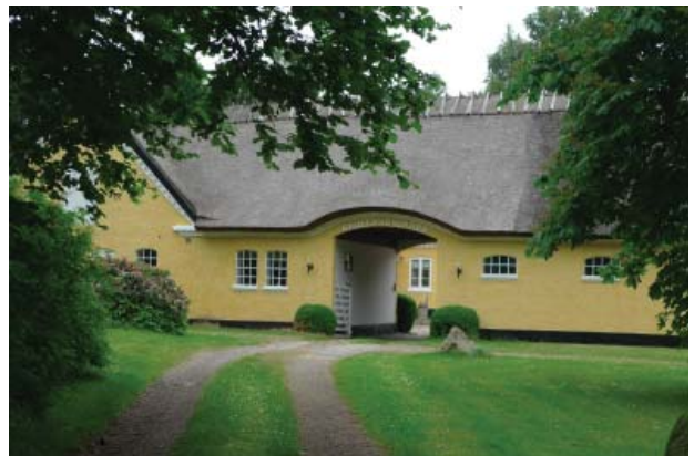
Flere af udflyttergårdene fremstår velbevarede, og byggeriets typekarakter står tydeligt frem.