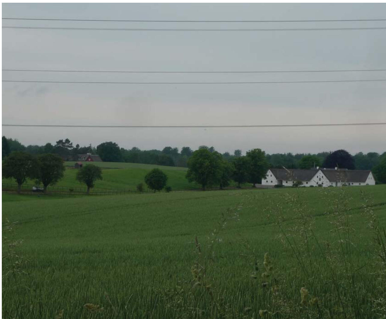
Velbevarede udflyttergårde i ejerlavets nordøstlige del skaber et karakteristisk og typerent udflytterlandskab

I selve landsbyen er vejforløbet og bebyggelsens skala væsentlige bærende træk, sammen med den åbne strækning med kig til markerne midt i landsbyen, de bevarede gårde, præstegården og kirkegården med kirkegårdsmur. Enkelte store træer er med til at give landsbygaden karakter.