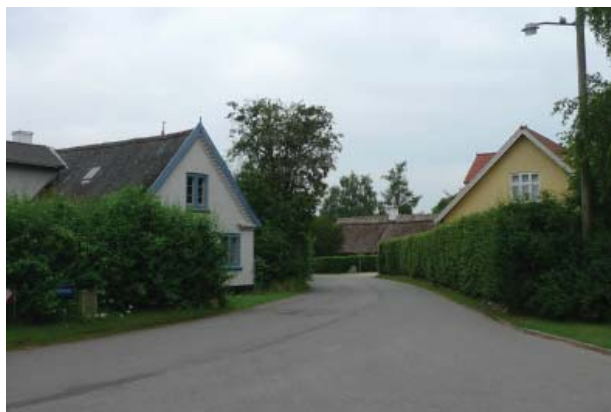
Den slyngede landsbygade samler bebyggelsen, som præges af en ensartethed i proportioner og en varieret og afvekslende placering i forhold til vejen.

Landsbyen præges især af den slyngede bygade, som giver mange fine og varierede kig, og med kirken som det naturlige fikspunkt. Landsbyen er opbygget i to klumper mod øst og vest, med et åbent stykke midtpå, hvor byens gamle smedje ligger. Det åbne stykke sikrer fine kig til de dyrkede marker omkring byen.