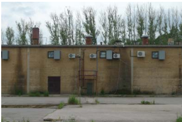
Prøvelyst Teglværk er i dag delvist ude af drift, men fremstår som et karakteristiske lille miljø for sig selv med teglværksbygninger og arbejderboliger

Forekomsten af fint ler i issølavningerne i området betød, at der kunne etableres teglværker i området, og i den vestlige del af ejerlavet er en hel lille bebyggelse opstået omkring Prøvelyst teglværk.